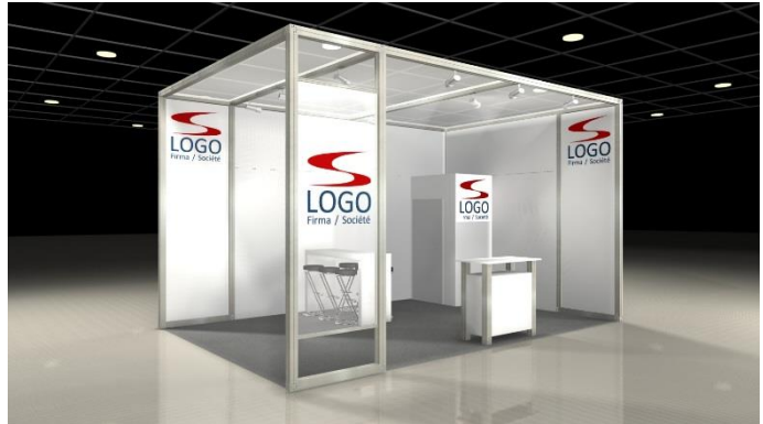
Beispiel: DELUXE, 24 m 2 Eckstand