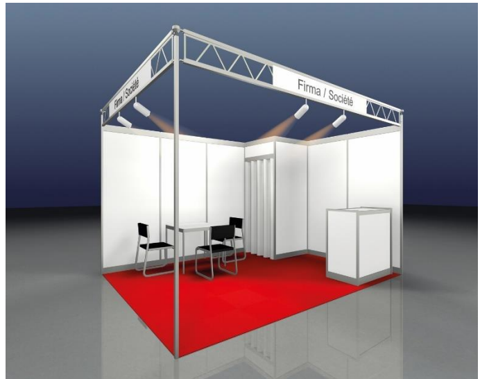
Beispiel: BUDGET, 12m 2 Eckstand