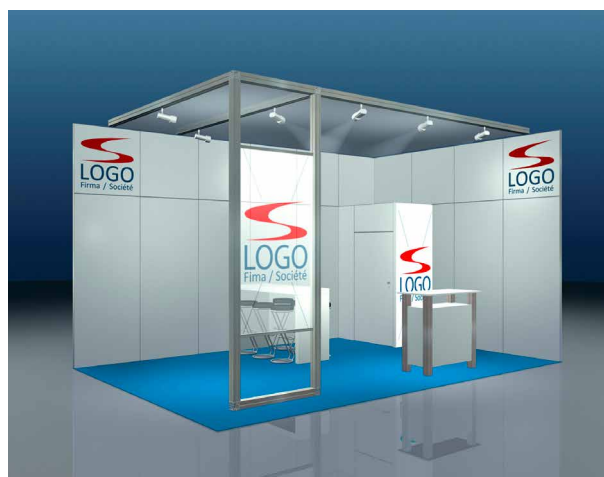
Beispiel: DELUXE, 24 m 2 Eckstand