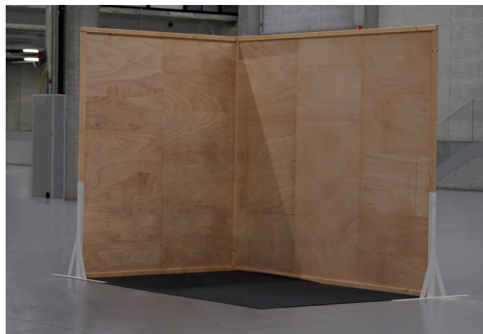
Exemple: BASIC, stand d'angle de 6 m 2