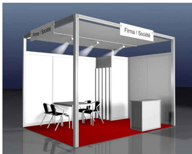
Beispiel: COMFORT, 12m 2 Eckstand