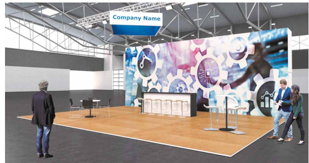
Beispiel: XL-PREMIUM, 80 m 2 Kopfstand

(mit Upgrade Optionen – mit Laminat und Weitsichtwürfel)