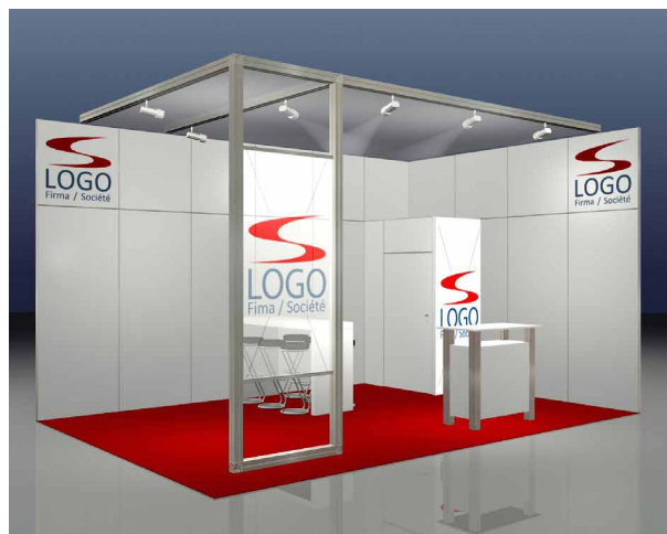
Beispiel: DELUXE, 24 m 2 Eckstand

Damit Sie auch im digitalen Raum optimal auftreten, ist das Kommunikationspaket BASIC inklusive.