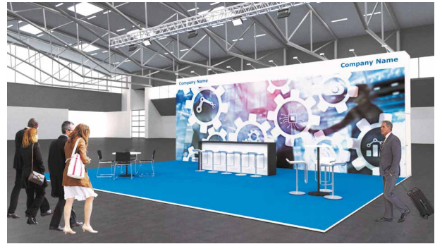
Beispiel: XL-PREMIUM, 80 m 2 Kopfstand (Standard)