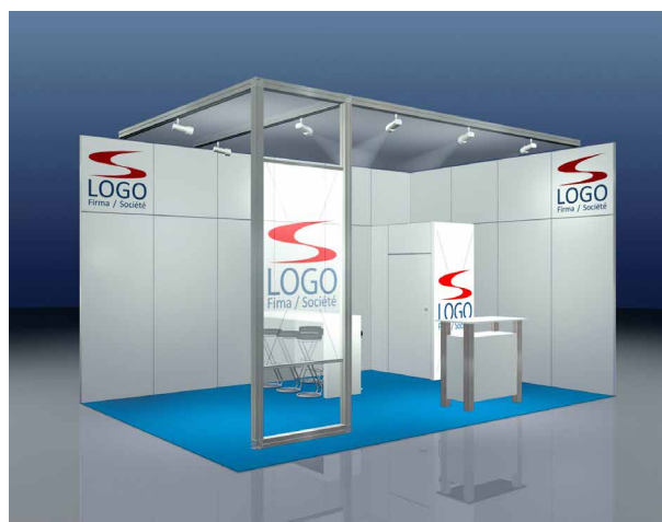
Exemple: DELUXE, 12 m 2 stand d'angle